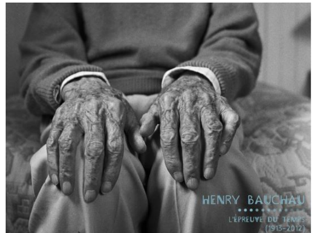
Henry Bauchau, l'épreuve du temps (1913-2012) Epub & Exposition, 2018.

Pour célébrer le Centenaire, le Fonds Henry Bauchau de l'UCLouvain avait organisé un colloque, Henry Bauchau, le don d'intériorité , en partenariat avec le Musée royal de Mariemont, l'Université de Cergy-Pontoise et le Collège Belgique (Académie royale de Belgique), ainsi qu'une exposition d'ampleur intitulée Henry Bauchau. L'épreuve du temps : archives, œuvres, peintures, dessins et sculptures de l'auteur, entretiens ou adaptations de ses œuvres dépeignaient les métamorphoses d'un homme d'action en écrivain. Jusqu'alors si l'enregistrement audio de certains exposés était disponible sur le site de l'Académie ( https://lacademie.tv/cycles/henry-bauchau ), la plupart des contenus de ces recherches, conférences, colloques, rencontres et exposition étaient restés inédits, tant les matières convoquées se prêtaient peu à la publication traditionnelle.